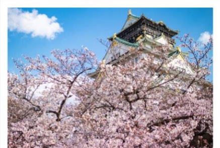
▲大阪城公园的樱花 (左右) 和 大阪重粒子线中心 (中央)