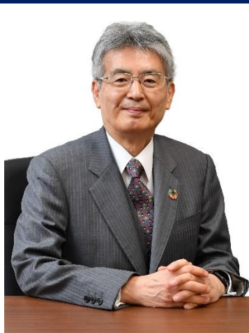
公益財団法人大阪国際がん治療財団 理事長 平野 俊夫