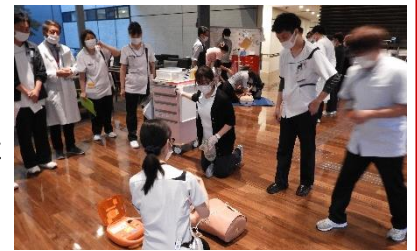
2021年11月17日に行った BLS(一次救命措置)研修の様様

末筆となりましたが、本年も皆様にとって幸多い年でありますよう御祈り申し上げます。ご挨拶とさせていただきます。